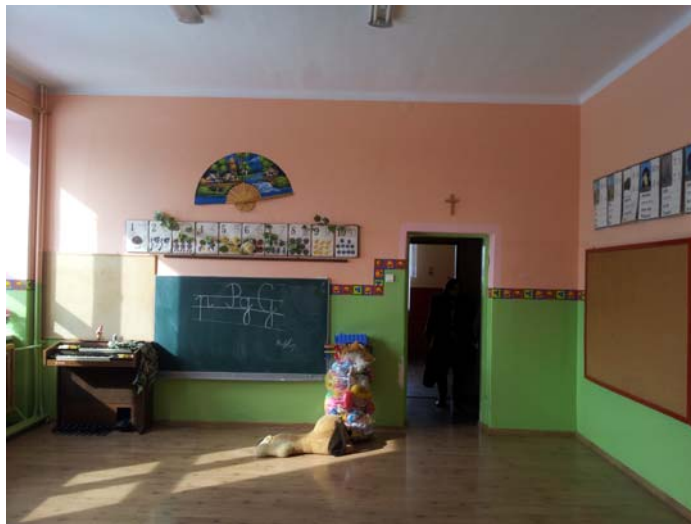
Fot. Nr 4 Pokój zajęć do remontu