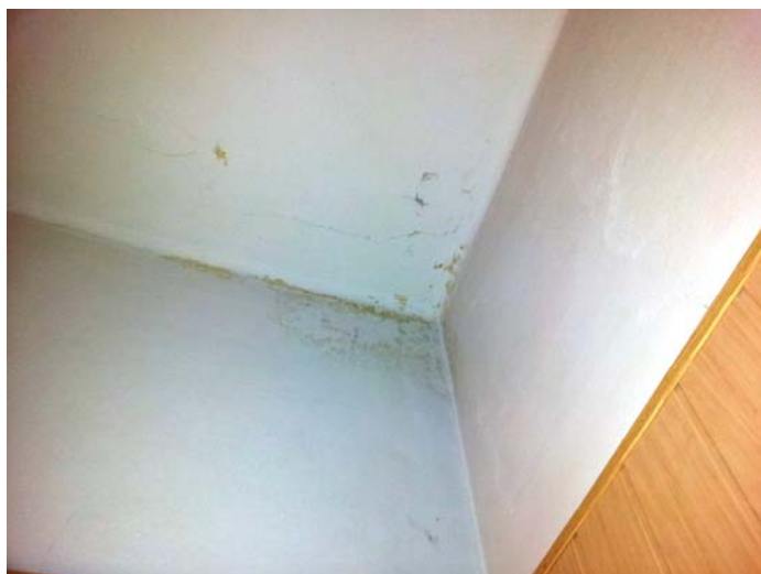
Fot. Nr 6 Ściana i sufit do wymiany tynku, boazeria do demontażu