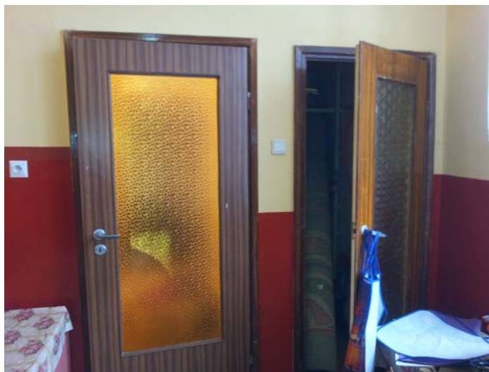
Fot. Nr 5 Stolarka drzwiowa do wymiany