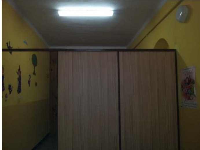
Fot. Nr 1 Ścianka działowa w szatni do demontażu