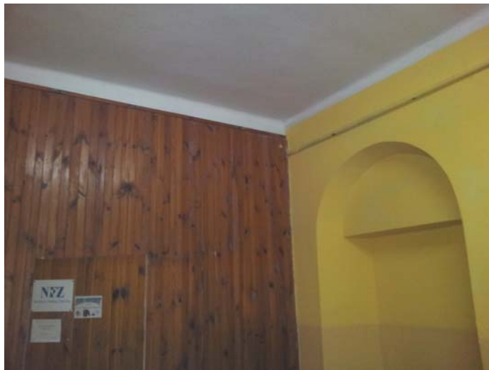
Fot. Nr 2 Szatnia- boazeria do demontażu