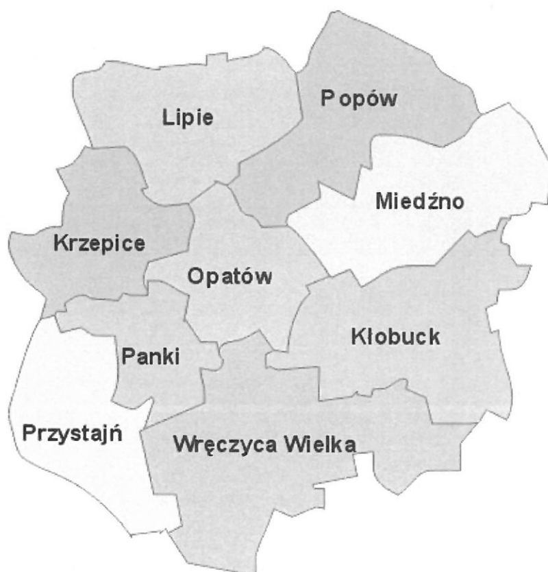
Rysunek 1. Gmina Opatów w powiecie kłobuckim

Gmina Opatów zajmuje obszar 73,54 km 2 . Według danych GUS na koniec 2019 roku Gmina liczyła 6.818 mieszkańców, a gęstość zaludnienia to 93 osób/km 2 . Gmina Opatów leży w środkowej części powiatu kłobuckiego.